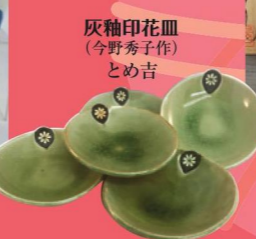
灰釉印花皿 (今野秀子作) とめ吉