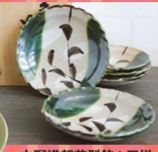
志野織部花型銘々皿揃 器の大和屋