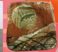
織部武蔵野皿 井筒