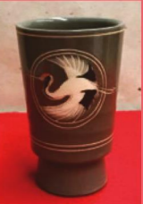
荘山窯 鶴絵ゴブレット カネヨ陶磁館

主催 織部なでしこ会・多治見市産業文化センター 事務局 (株)華柳 TEL0572-21-2765