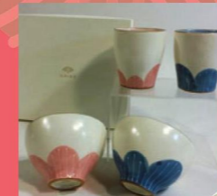
ふわり陸揃(オリジナル商品) 織部うつわ邸

7ヶ所のスタンプを集めると もれなくプチ菓子プレゼント! さらに応募にて抽選で10名様に 豪華美濃焼が当たります!! 掲載写真 他3点