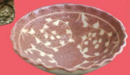
志野輪花鉢 ギャラリー仙太郎